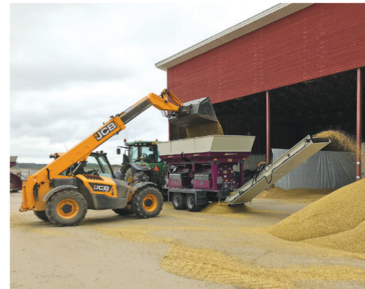
▲ Новинка Murska 4000

нес-идеи до крупного производства, поставляющего продукцию на экспорт в десятки стран. Что определило успех?