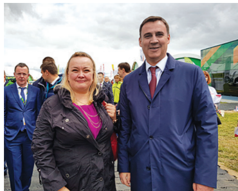
▲ Министр сельского хозяйства РФ Д.Н.Патрушев и Т.Корте

Всероссийский день поля – это встречи на высшем уровне.