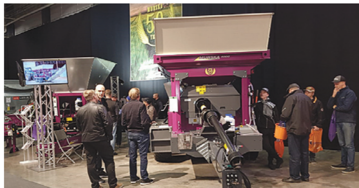
▲ Стенд компании Aimo Kortteen Konepaja Oy на выставке Koneagria в Ювяскюля

обусловлена тем, что корм оптимально переваривается в пищеварительном тракте животных. Технология Мурска также обеспечивает создание безопасного и прослеживаемого корма, меньший углеродный след, сводит к минимуму транспортные перевозки, устраняет экологическую и экономическую нагрузку от сушки, а также повышает гарантированность сохранения урожая и естественным образом снижает число токсинов в пищевой цепи. Оптимальный и вкусный корм способствует здоровью и благополучию сельскохозяйственных животных. Именно так Murska вносит свой вклад в решение многих глобальных проблем сегодняшнего дня.